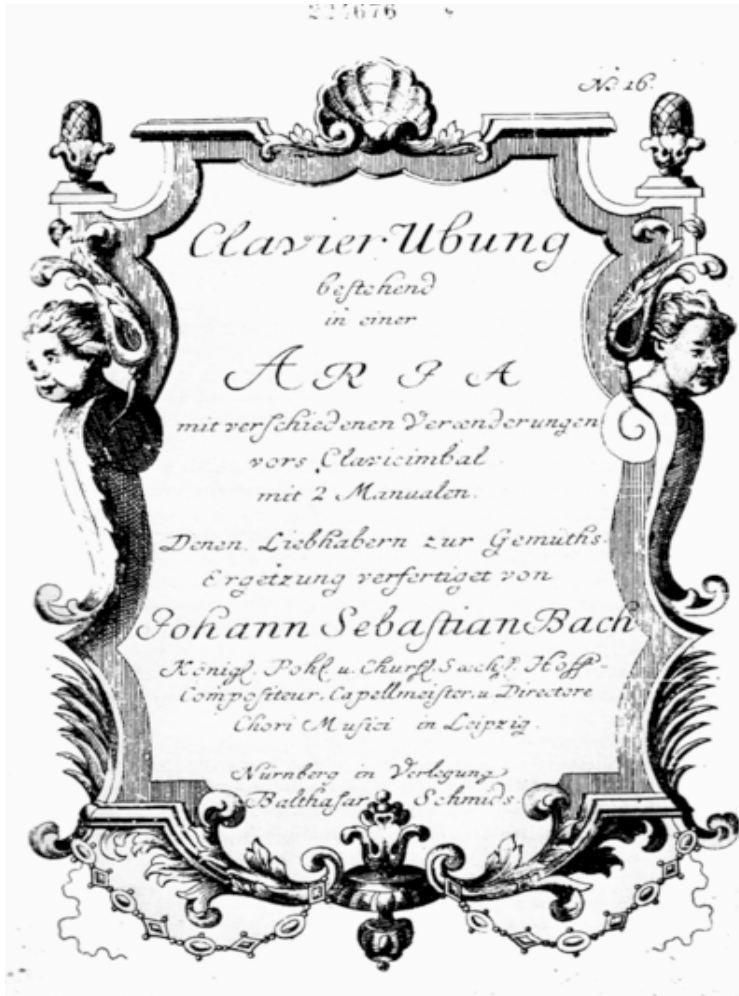
Titelbladet till 1:a utgåvan av Goldbergvariationerna 1741