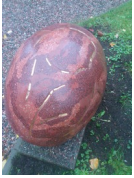
Lotta Melantons skulptur "Ägget" står i trädgården på Stora gatan 9