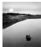
Fotografi av Pekka Sammalahiti www.svd.se/kultur/litteratur/till-konstverkens-karna_817877.svd

10. Tisdag 13 augusti 18.00. Författarbesök. Marie Lundqvist , flerfaldigt belönad poet, översättare och inläggande skribent om foto konst, talar om Poesi och fotografi . Marie är en av de få i vår offentlighet som skriver om fotografi. Deltagare i skivrarträff 11-14 aug. är särskilt välkomna att möta Marie; inbjudan f.ö. riktas alla andra som är intresserade av sambandet mellan text och bild. Vi behöver öva ett långsamt seende i det oavbrutna mediala bildbruset.