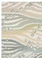
Matta av Britta Rendahl

2. Britta Rendahl-Ljusterdal är en av vårt lands mest hyllade textilkonstnärer , som smyckat många hem och offentliga miljöer, därav flera kyrkor, med sina utsökta verk och inspirerat flera generationer andra konstnärer. Britta visar oss några av sina arbeten och berättar om en livslång konstnärlig gärning i skönhetens tjänst.