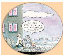
Teckning av Robert Nyberg

(I pratbubblan: Är det utflykt, eller skall rullstolen säljas?)