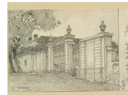
Ferdinand Bobergs teckning av Södra Porten i Lövstabruk; intill denna finns kulturföreningens lokaler (Stora gatan 9)